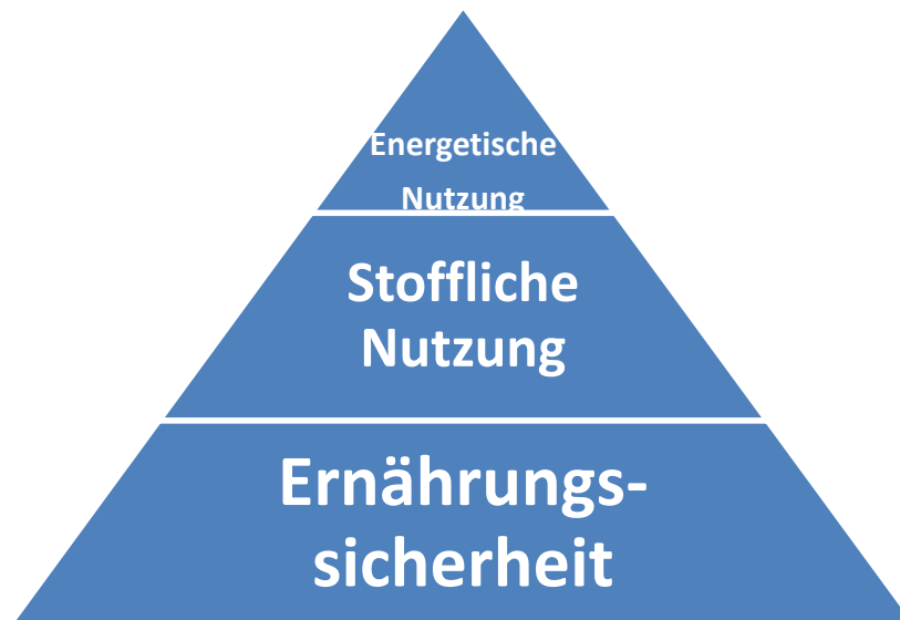
Nutzungspyramide von Biomasse

An erster Stelle steht die Ernährungssicherheit, danach folgen die stoffliche Nutzung und erst dann die energetische Nutzung. Der verantwortungs- und maßvolle Ausbau ist wichtig. Nutzungskonkurrenzen sollen vermieden werden.